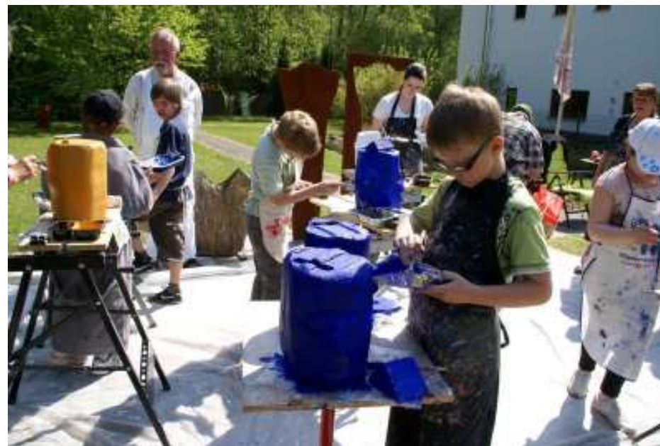
Konzentrierte Arbeit im Atelier Mauß