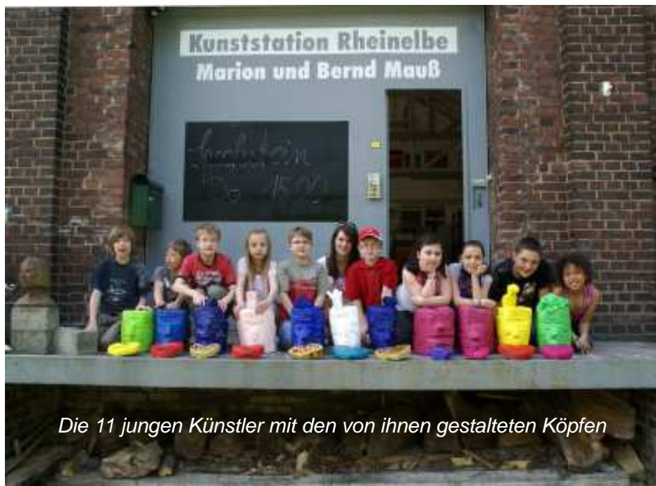
Die 11 jungen Künstler mit den von ihnen gestalteten Köpfen