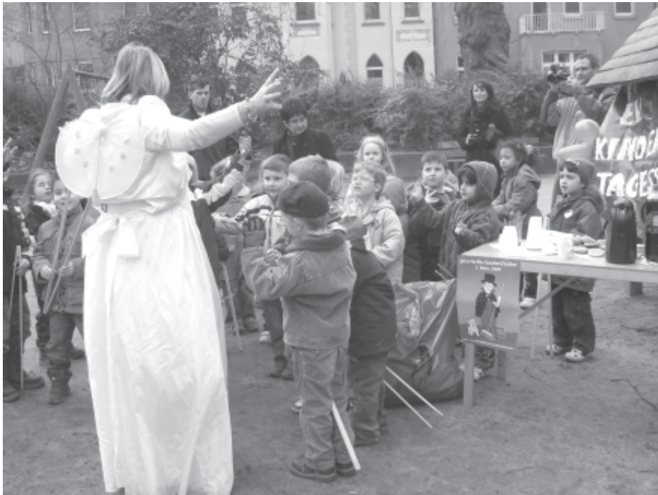
Auf diesen Engel hören die Kinder