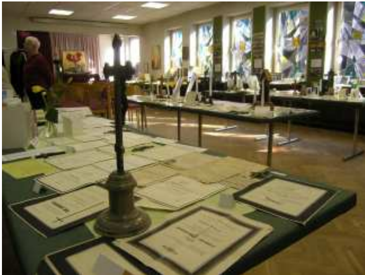
Ausstellung im Gemeinde- saal von St. Barbara in der dritten Märzwoche

Tag verstorben waren. Eine weitere Kostbarkeit hatte ebenfalls St. Joseph ausgeliehen, ein kalligrafisch geschriebenes Totengedenkbuch mit den in beiden Weltkriegen Gefallenen der Gemeinde.