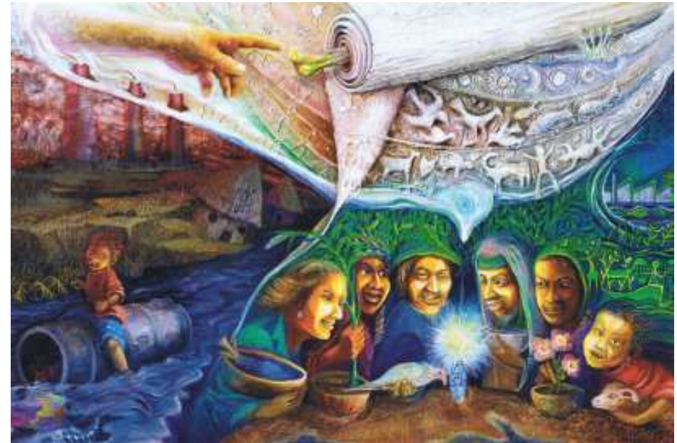
Gottes Schöpfung bewahren, damit alle leben können – Misereor Hungertuch 2009