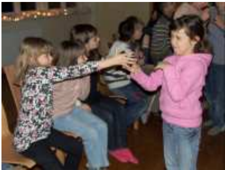
Ist es Zimt oder Knoblauch oder Minze?