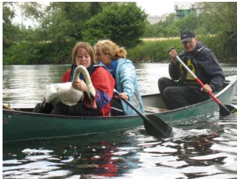
Jugendliche mit gerettetem Schwan.