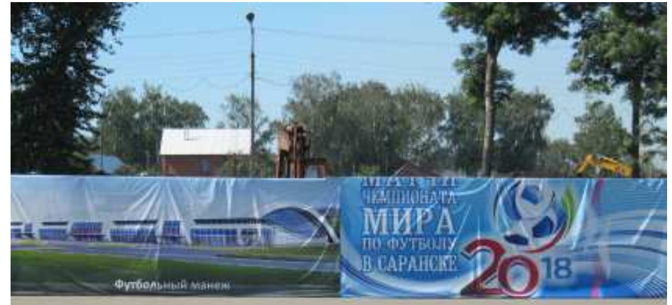
Plakat für die Fußball-WM 2018 mit geplanter Fußball-Arena

tos auch in der russischen Provinz inzwischen immer größer wird, herrscht den ganzen Tag über Dauerstau, was in der Sommerhitze für viel schlechte Luft sorgt.