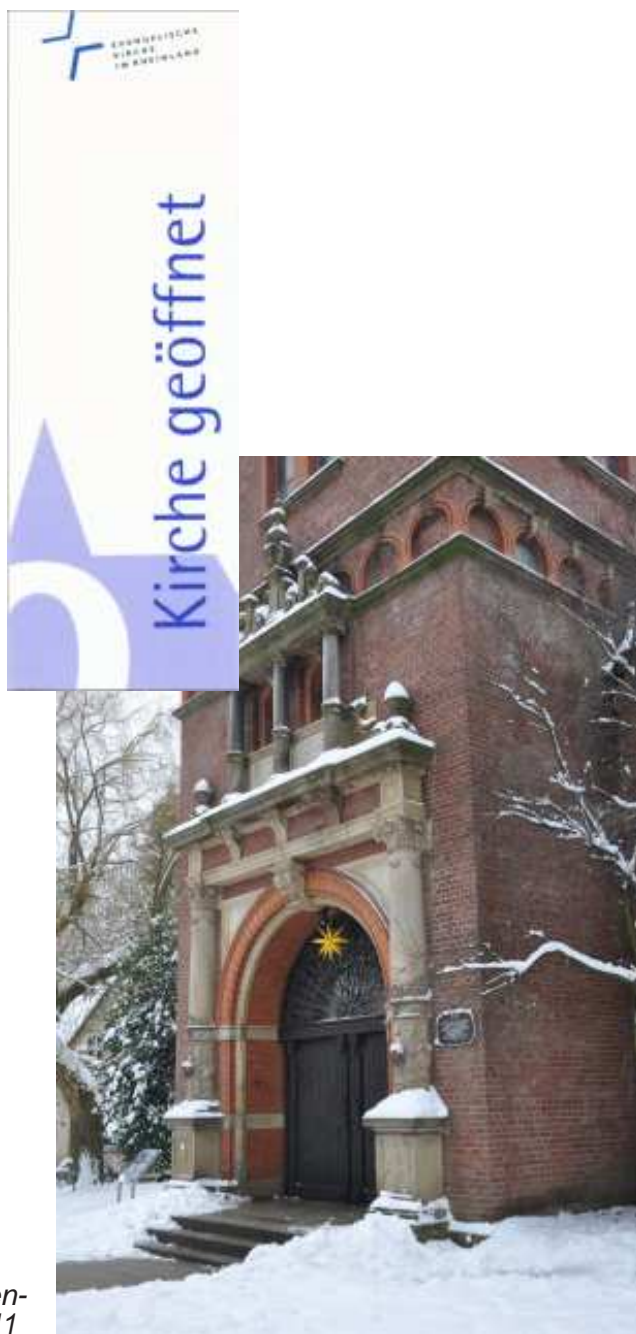
Die Alte Kirche an der Leither Straße in Essen-Kray im Winter 2010/11

Die Alte Kirche in der Leither Straße ist jeden Freitag von 10 – 12 Uhr geöffnet.