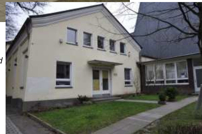
Gemeindehaus Isinger Feld, Meistersingerstr. 52 (oben) und Gemeindehaus Mitte, Leither Str. 33.

In diesen beiden Gemeindehäusern wird am 5. Februar gewählt. Die Evangelische Kirchengemeinde Essen-Kray wählt ihr Presbyterium.