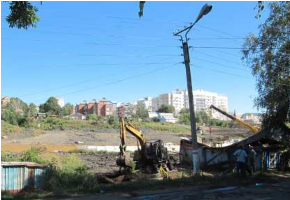
Altstadt von Saransk: Abriss der alten Holzhäuser in der Saransker Straße

Neben den Neubauten werden auch einige Fassaden von alten Häusern restauriert. Doch im Zentrum herrscht vorerst einmal Chaos. Der gesamte Autoverkehr muss aus dem Zentrum umgeleitet werden, und da die Zahl der Au-