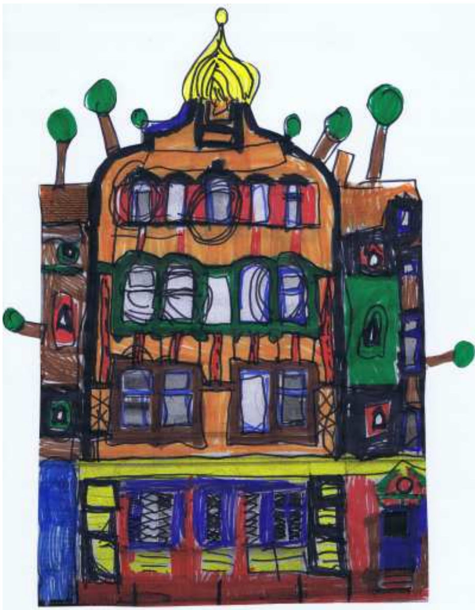
Ein "Hundertwasserhaus" aus einer 1. Klasse der Joachimschule