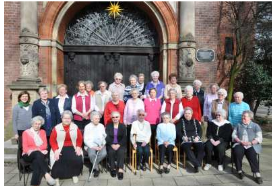
An einem sonnigen Aprilnachmittag entstand dieses Gruppenbild vor der Alten Kirche.